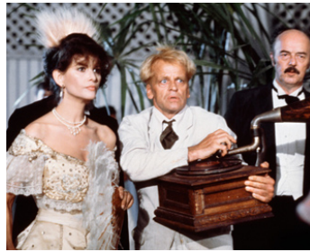
1981 FITZCARRALDO (Fitzcarraldo) de Werner Herzog avec Klaus Kinski