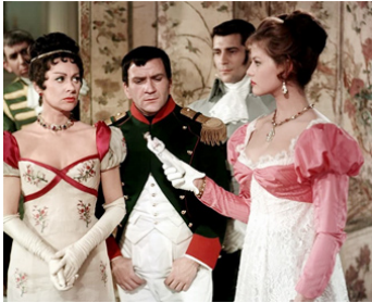
1960 AUSTERLITZ d'Abel Gance avec Martine Carol, Pierre Mondy