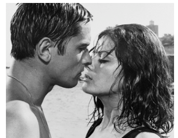
1965 LES CENTURIONS (Lost Command) de Mark Robson avec Alain Delon