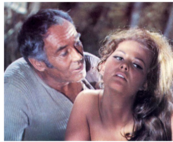
1968 IL ÉTAIT UNE FOIS DANS L'OUEST (C'era una volta il West) de Sergio Leone