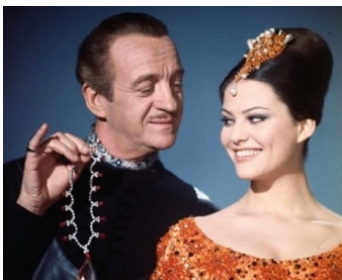
1963 LA PANTHÈRE ROSE (The Pink Panther) de Blake Edwards avec David Niven