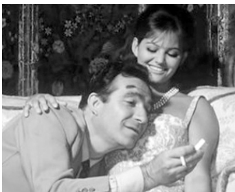
1964 LE COCU MAGNIFIQUE (Il magnifico Cornuto) d'A. Pietrangeli avec Ugo Tognazzi