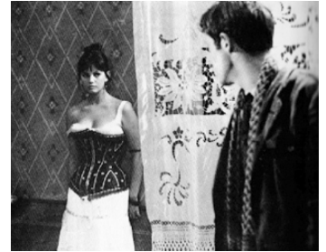
1961 LE MAUVAIS CHEMIN (La Viaccia) de Mauro Bolognini avec Jean-Paul Belmondo