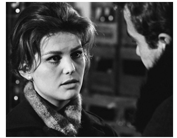
1960 ROCCO ET SES FRÈRES (Rocco i suoi fratelli) de Luchino Visconti