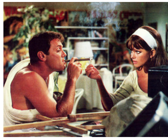
1967 COMMENT RÉUSSIR EN AMOUR... (Don't make waves) d'A. Mackendrick avec Tony Curtis