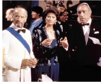
1980 LA SALAMANDRE (The Salamander) de Peter Zinner avec Eli Wallach, Anthony Quinn