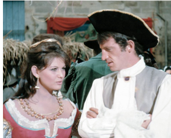
1962 CARTOUCHE de Philippe de Broca avec Jean-Paul Belmondo