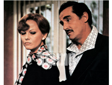
1974 HISTOIRE D'AIMER (A mezzanotte va la ronda del piacere) de Marcello Fondato avec V. Gassman