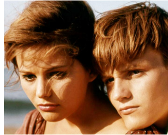
1960 LA FILLE À LA VALISE (La Ragazza con la valigia) de Valerio Zurlini avec Jacques Perrin