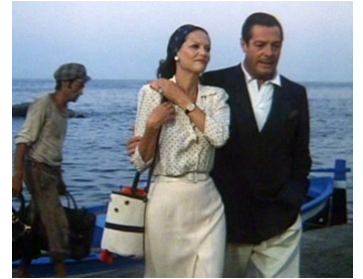
1980 LA PEAU (La Pelle) de Liliana Cavani avec Marcello Mastroianni