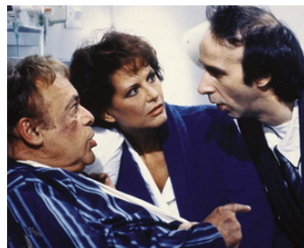
1992 LE FILS DE LA PANTHÈRE ROSE (Son of the Pink Panther) de B. Edwards avec H. Lom, Roberto Benigni