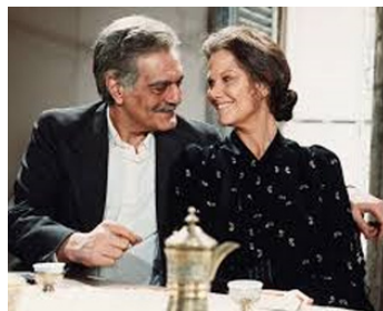
1991 MAYRIG/588 RUE PARADIS d'Henri Verneuil avec Omar Sharif