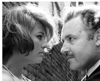
1963 LES DEUX RIVALES (Gli Inffifferenti) de Francesco Maselli avec Rod Steiger