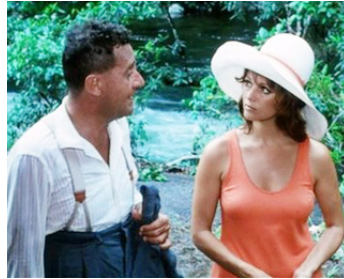
1970 BELLE ET HONNÊTE (Bello, onesto, emigrato Australia...) de M. Zampa avec Alberto Sordi