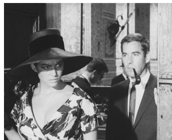
1965 SANDRA (Vaghe stelle dell'orsa) de Luchino Visconti avec Michael Craig