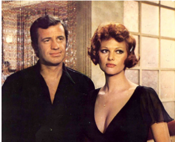
1971 LA SCOUMOUNE de José Giovanni avec Jean-Paul Belmondo