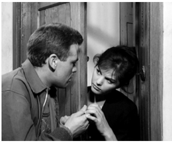
1958 LE PIGEON (I soliti ignoti) de Mario Monicelli avec Renato Salvatori