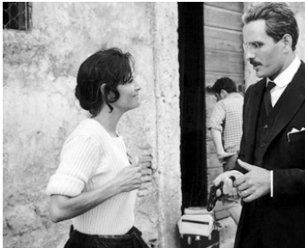
1976 L'AFFAIRE MORI (Il Prefetto di Ferro) de Pasquale Squitieri avec Giuliano Gemma