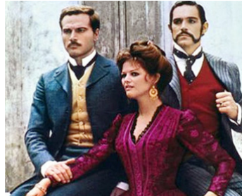
1973 LUCIA ET LES GUAPES (I Guappi) de Pascale Squitieri avec Franco Nero, Fabio Testi