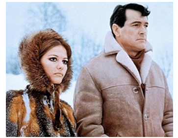
1968 UN COUPLE PAS ORDINAIRE (Ruba al prossimo tuo) de Francesco Maselli avec Rock Hudson