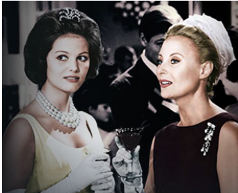
1961 LES LIONS SONT LÂCHÉS d'Henri Verneuil avec Michèle Morgan, Danielle Darrieux