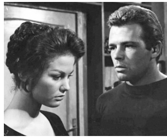
1959 HOLD-UP À LA MILANAISE (Audace colpo dei soliti ignoti) de Nanni Loy avec R. Salvatori