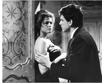
1960 LES DAUPHINS (I Delfini) de Francesco Maselli avec Tomas Milian