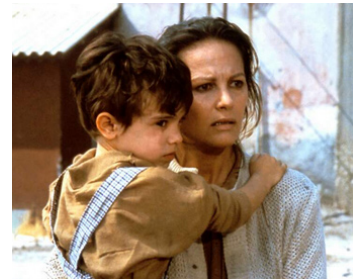
1985 LA STORIA (La Storia) de Luigi Comencini avec Andrea Spada