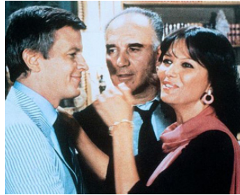
1977 LA PART DU FEU d'Étienne Périer avec Jacques Perrin, Michel Piccoli