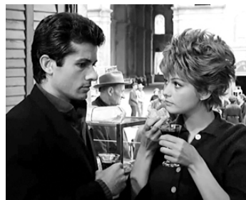
1963 LA RAGAZZA (La Ragazza di Bube) de Luigi Comencini avec George Chakiris