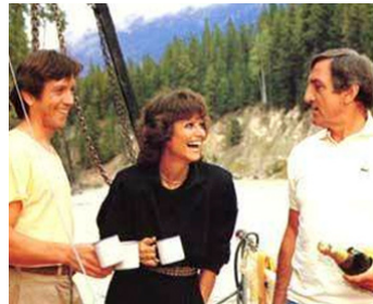
1982 LE RUFFIAN de José Giovanni avec Bernard Giraudeau, Lino Ventura