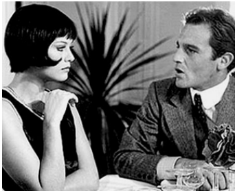
1962 QUAND LA CHAIR SUCCOMBE (Senilità) de Mauro Bolognini avec Philippe Leroy