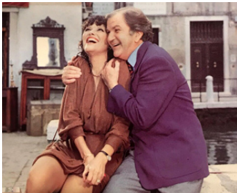
1981 LE CADEAU de Michel Lang avec Pierre Mondy