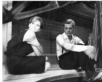
1962 HUIT ET DEMI (Otto e mezzo) de Federico Fellini avec Marcello Mastroianni