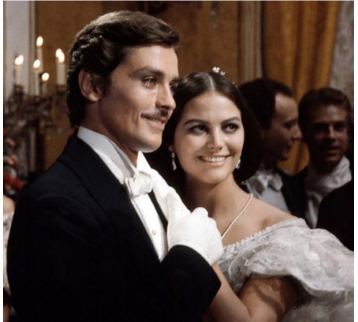
1963 LE GUÉPARD (Il Gattopardo) de Luchino Visconti avec Alain Delon