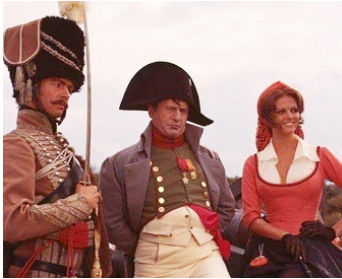
1970 LES AVENTURES DE GÉRARD (Adventures of Brigadier Gerard) de J. Skolimowski avec E. Wallach