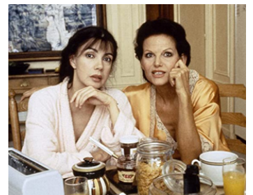
1996 ELLES NE PENSENT QU'À ÇA de Charlotte Dubreuil avec Carole Laure