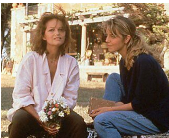
1986 UN HOMME AMOUREUX de Diane Kurys avec Greta Scacchi