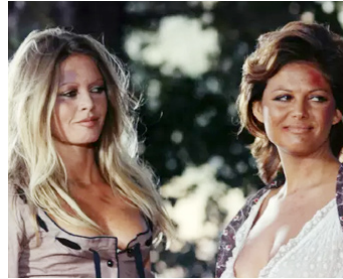
1971 LES PÉTROLEUSES de Christian-Jaques avec Brigitte Bardot