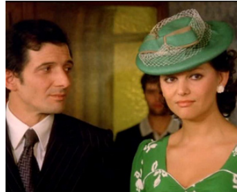
1973 LIBERTÉ, MON AMOUR (Libera, amore mio) de Mauro Bolognini avec Bruno Cirino